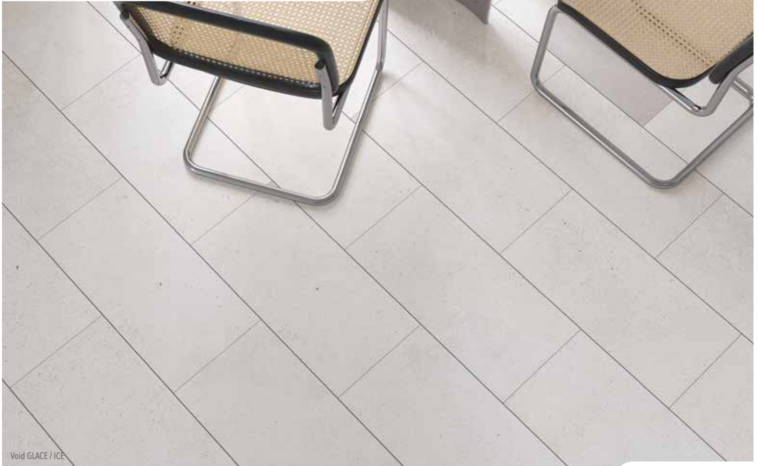
Void GLACE / ICE