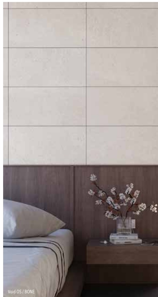
Void OS / BONE