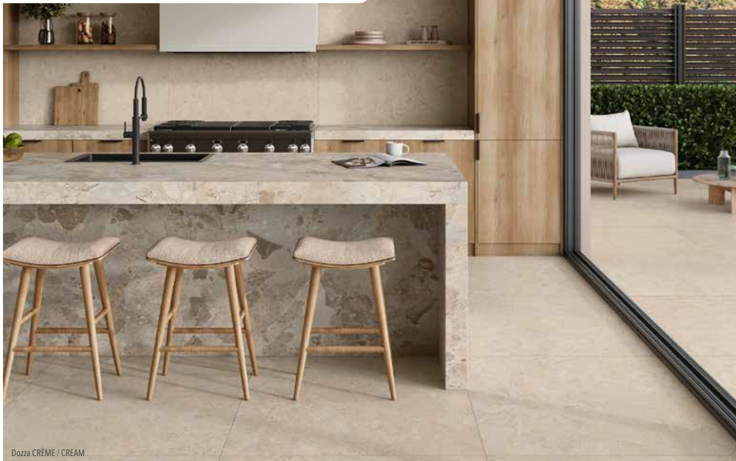
Dozza CRÈME / CREAM