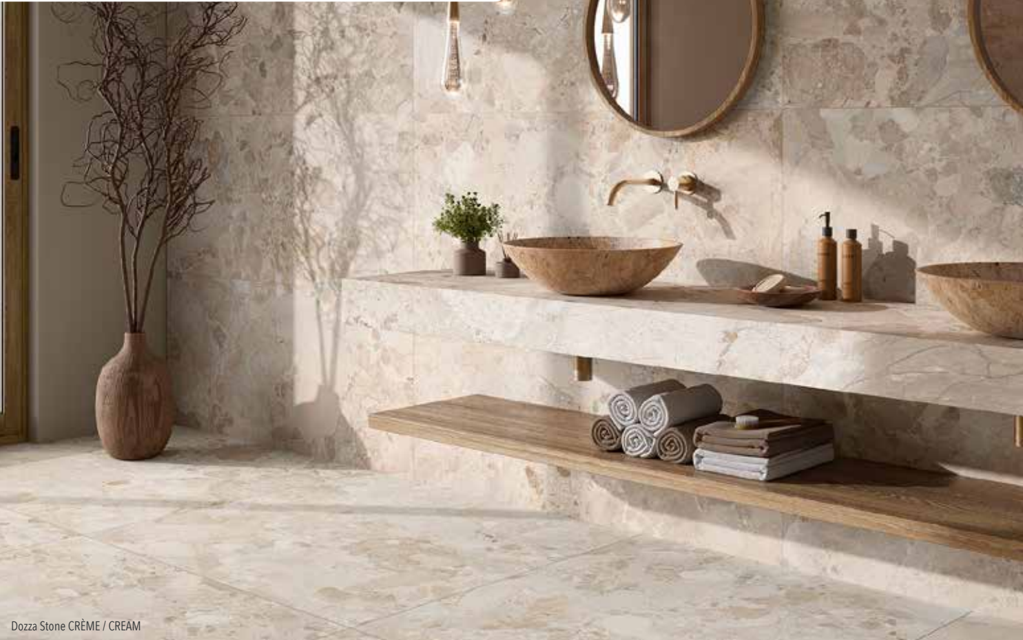
Dozza Stone CRÈME / CREAM