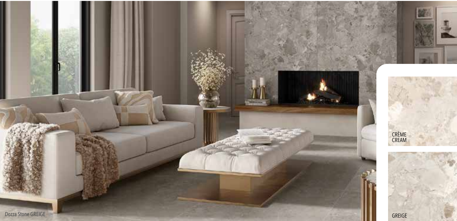
Dozza Stone GREIGE