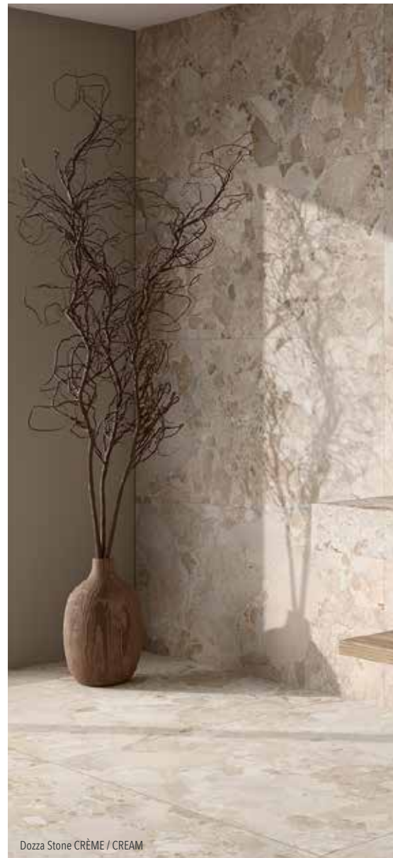
Dozza Stone CRÈME / CREAM