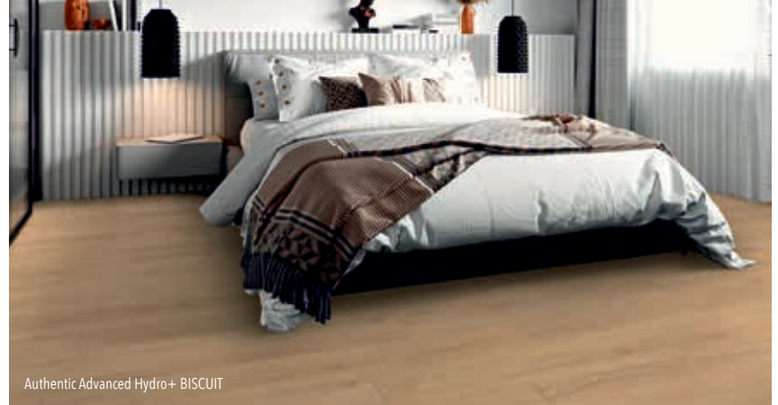
Authentic Advanced Hydro+ BISCUIT