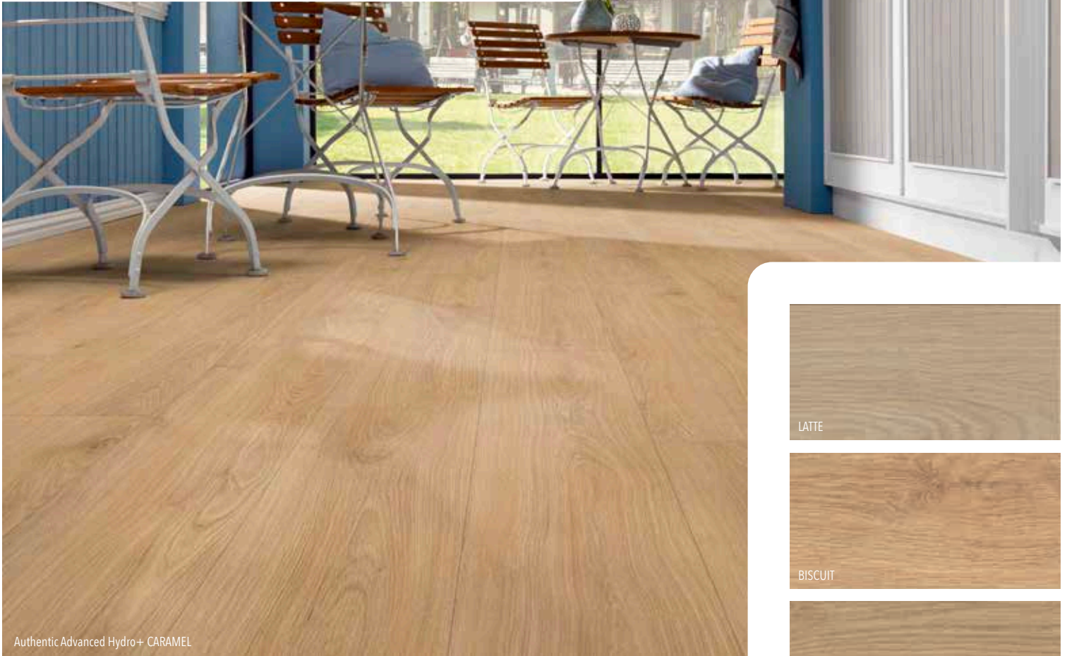
Authentic Advanced Hydro+ CAMEL