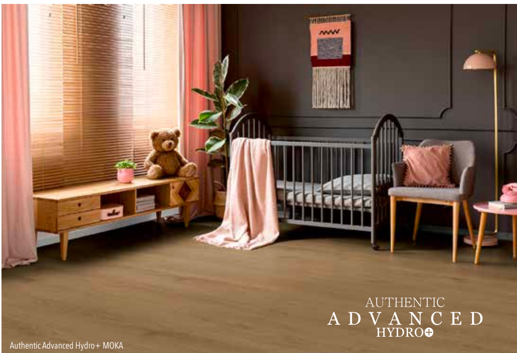
Authentic Advanced Hydro+ MOKA