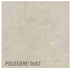
POUSSIÈRE / DUST