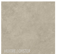
HUITRE / OYSTER