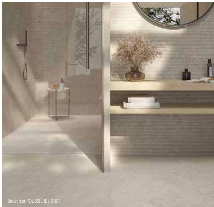
Boost Icor POUSSIERE / DUST