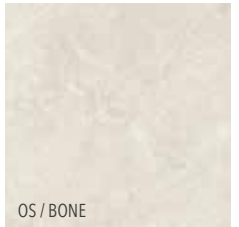
OS / BONE