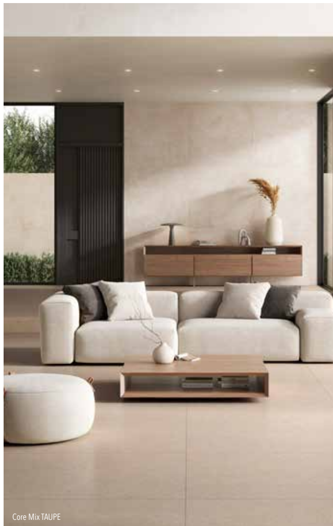
Core Mix TAUPE