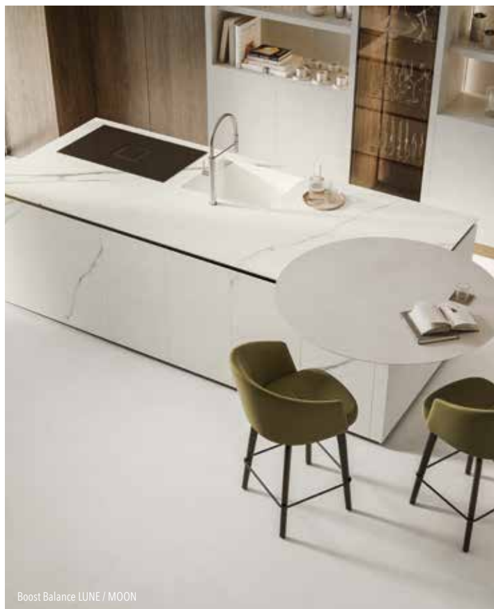
Boost Balance LUNE / MOON