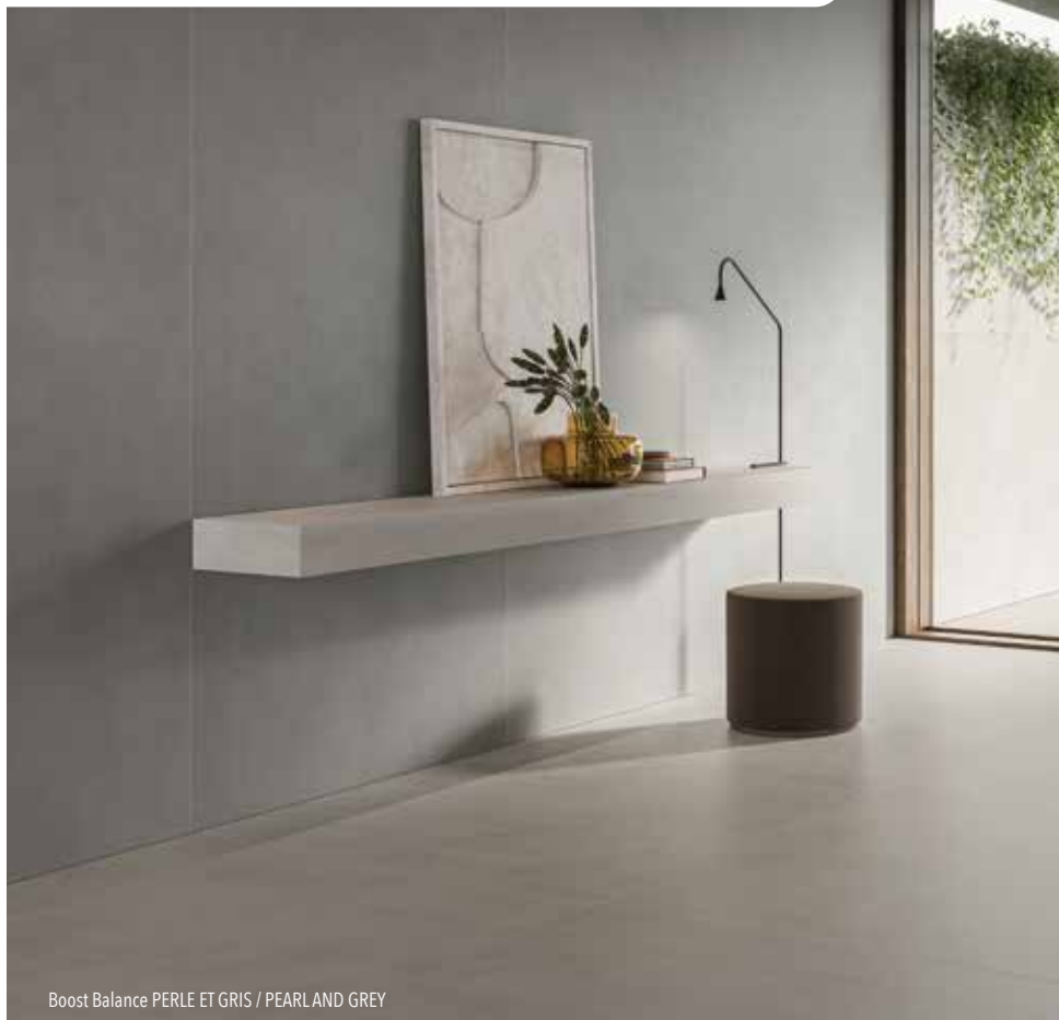
Boost Balance PERLE ET GRIS / PEARLAND GREY