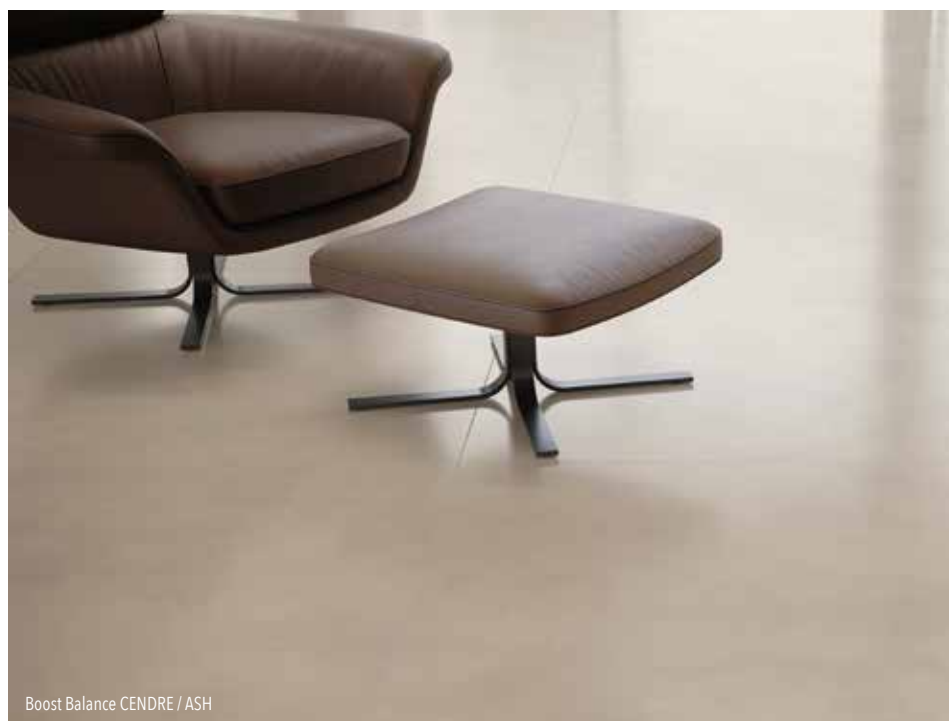
Boost Balance CENDRE / ASH