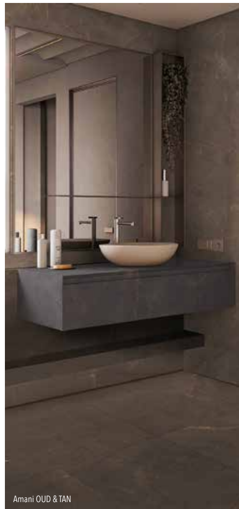
Amani OUD & TAN