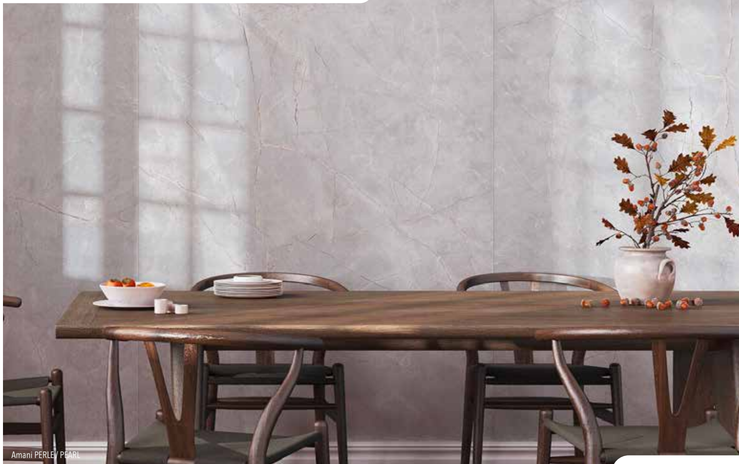
Amani PERLE / PEARL