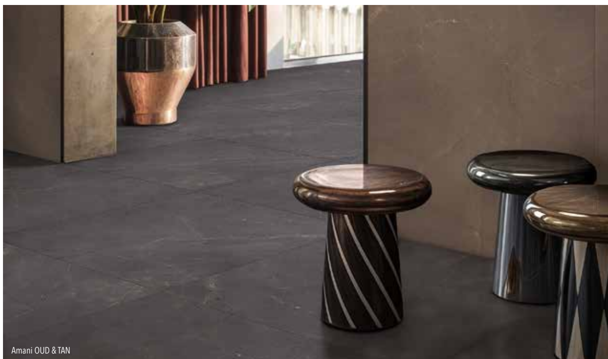
Amani OUD & TAN