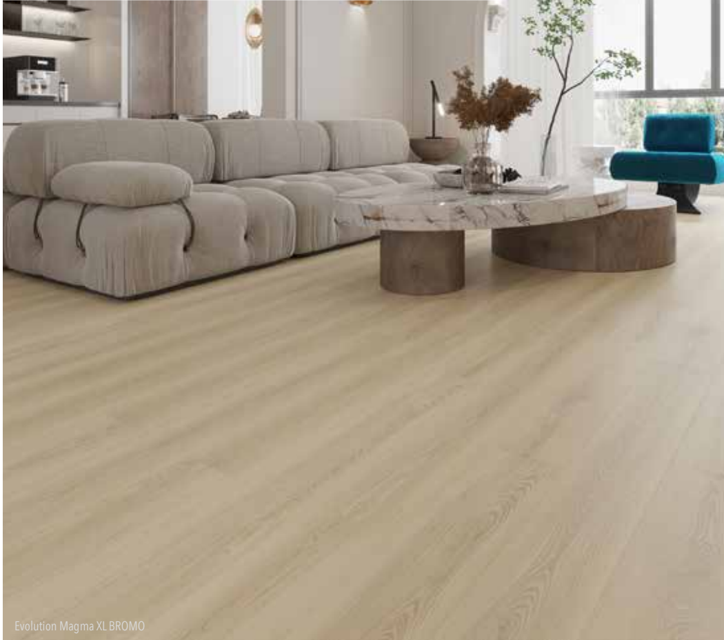
Evolution Magma XL BROMO