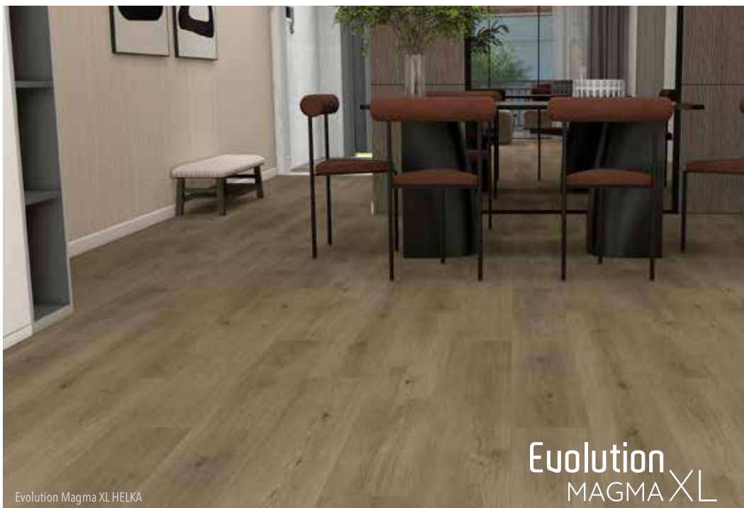
Evolution Magma XL HELKA