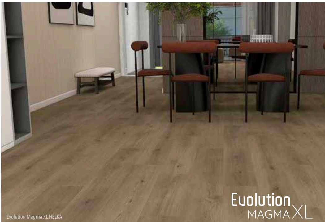
Evolution Magma XL HELKA