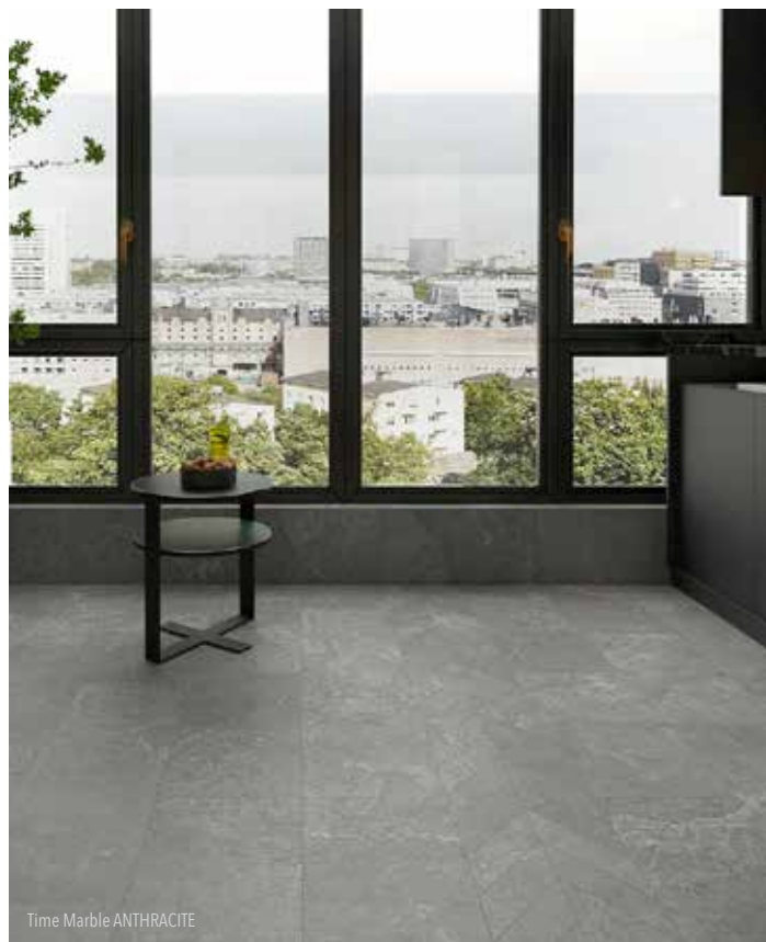
Time Marble ANTHRACITE