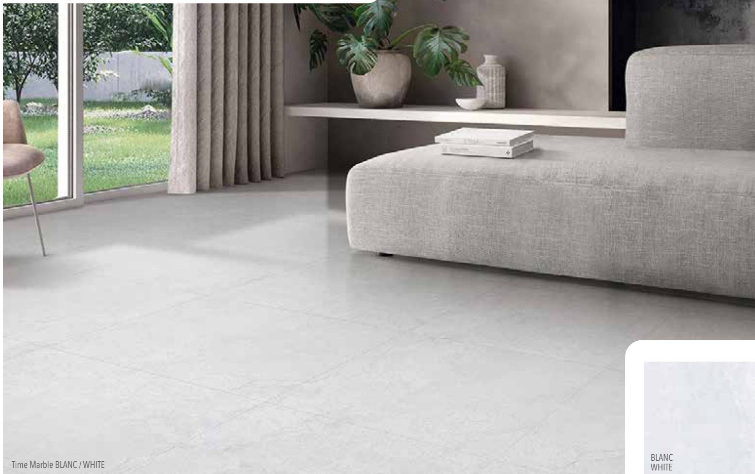
Time Marble BLANC / WHITE