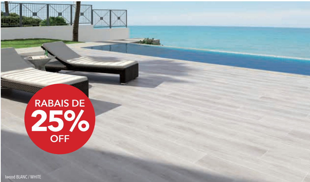
Iwood BLANC / WHITE