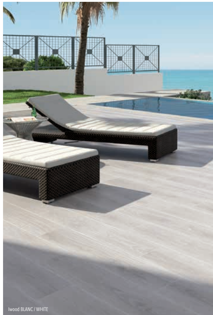
Iwood BLANC / WHITE