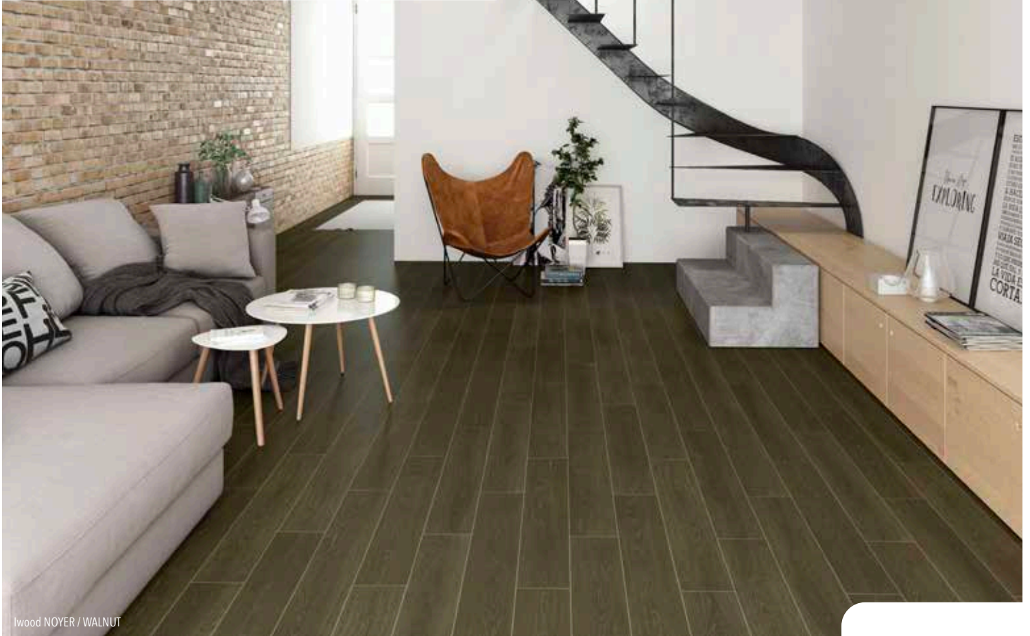
Iwood NOYER / WALNUT