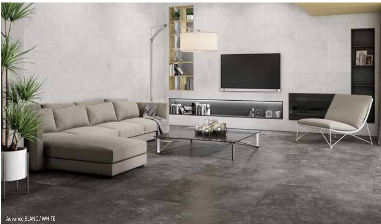
Advance BLANC / WHITE