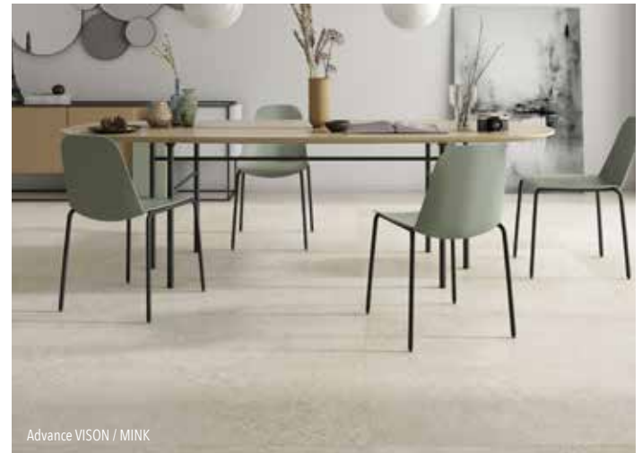
Advance VISON / MINK