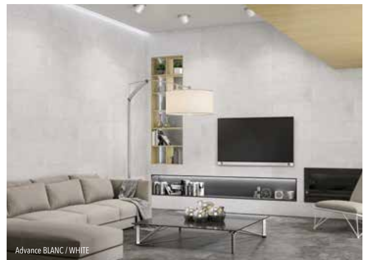
Advance BLANC / WHITE