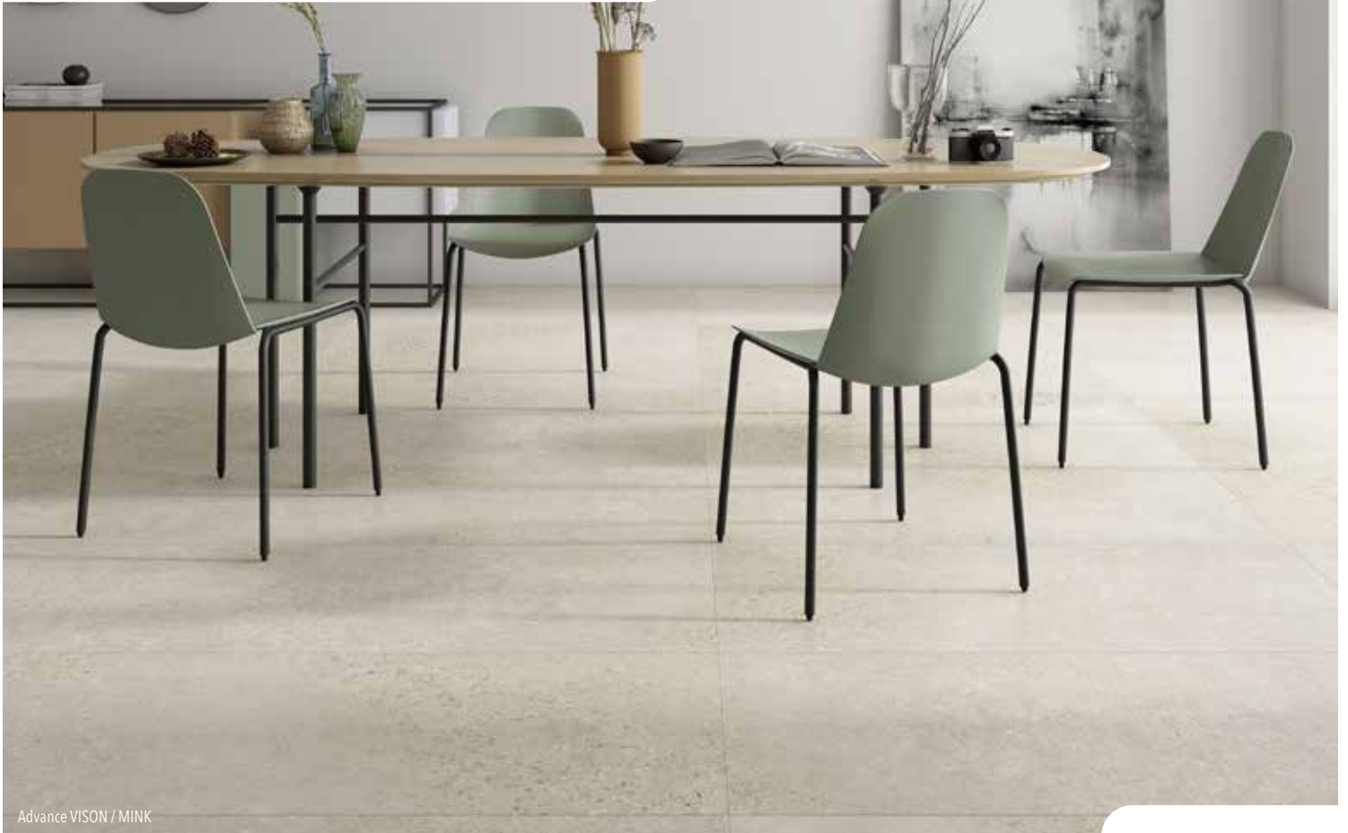
Advance VISON / MINK