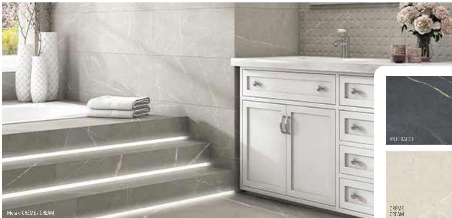
Meraki CRÈME / CREAM