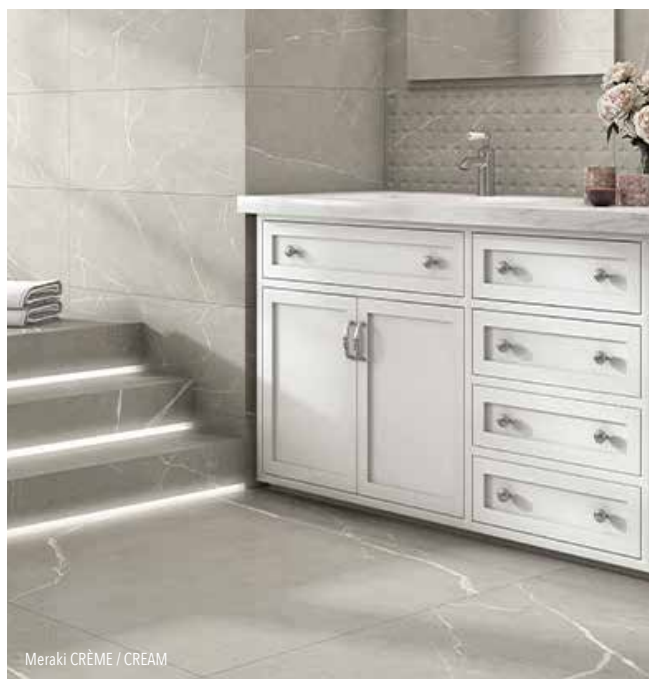
Meraki CRÈME / CREAM