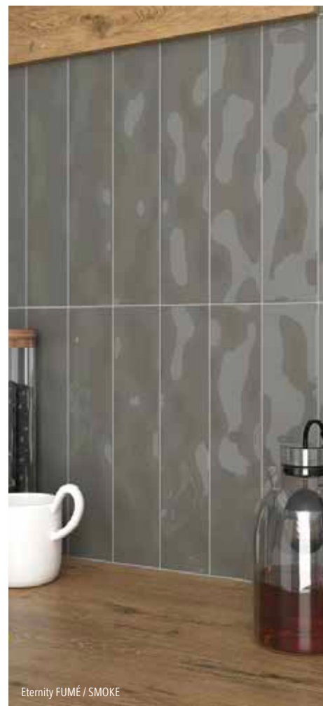
Eternity FUMÉ / SMOKE

GRIS LUSTRÉ GREY GLOSSY 4 x 12 56125500412G 4 x 16 56125500416G