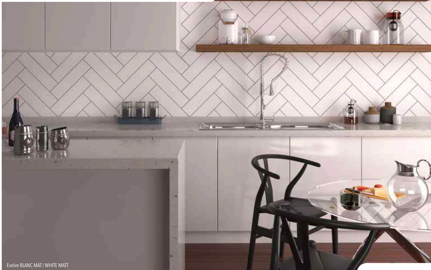
Evolve BLANC MAT / WHITE MATT